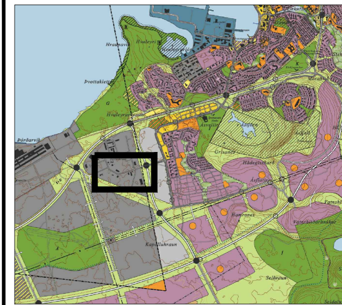
HLUTI AÐALSKIPULAGS HAFNARFJARÐAR 2005 - 2025